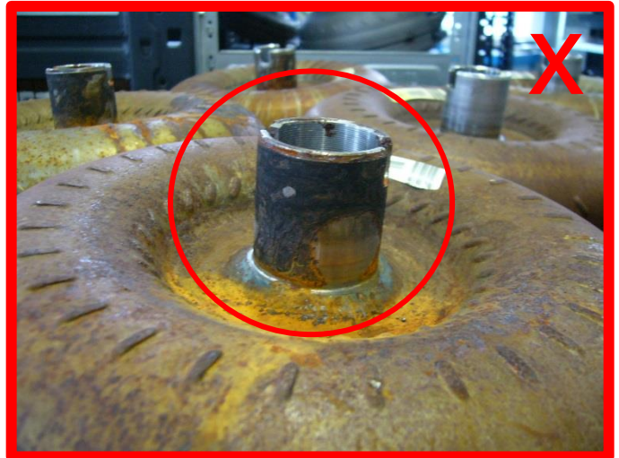
Starke Korrosion, Fraßkorrosion (insbesondere an der Nabe) → unzulässig