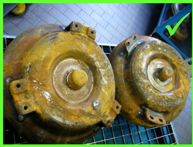
Leichter Oberflächenrost → zulässig