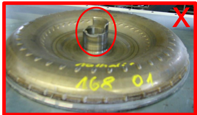
Nabe gebrochen / beschädigt → unzulässig