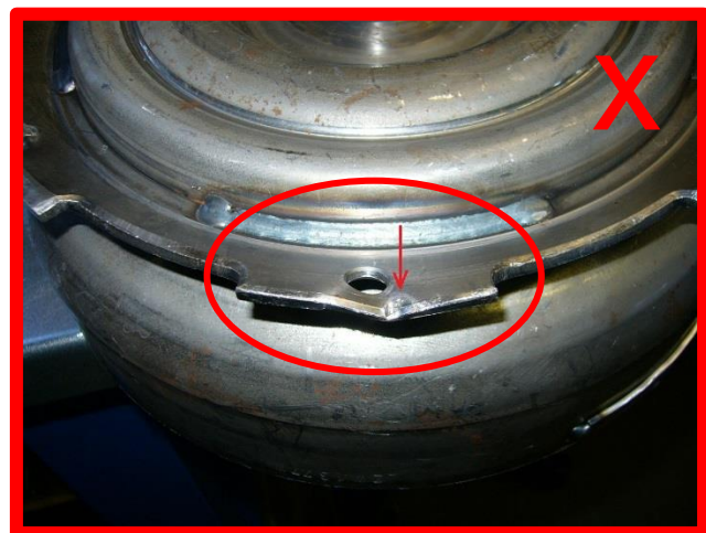
Befestigungskranz beschädigt → unzulässig