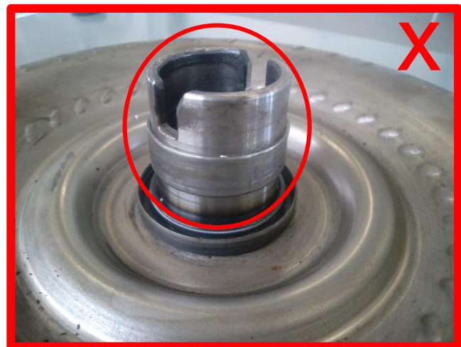
Pumpenbuchse auf der Nabe festgefressen → unzulässig