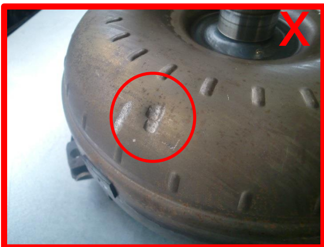
Gehäuse beschädigt → unzulässig