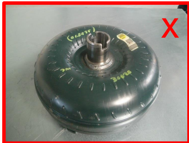
Lackierung durch Fremdreparatur, bzw. Instandsetzung durch Fremdhersteller → unzulässig