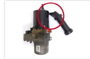
Abb. 6: Behälter beschädigt