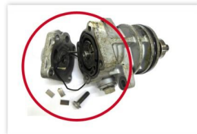
Abb. 8: Bauteil demontiert