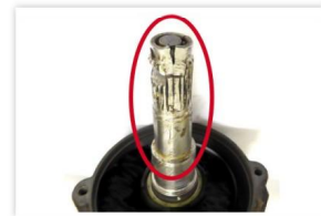
Abb. 3: Pinion defekt