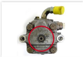
Abb. 7: Welle durchgeschlagen