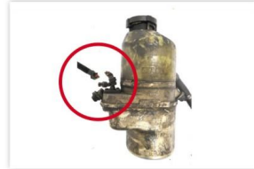
Abb. 5: Kabel abgeschnitten