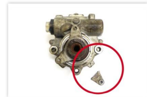
Abb. 9: Adapter beschädigt