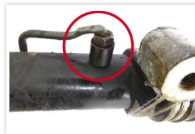
Abb. 2: Leitung beschädigt